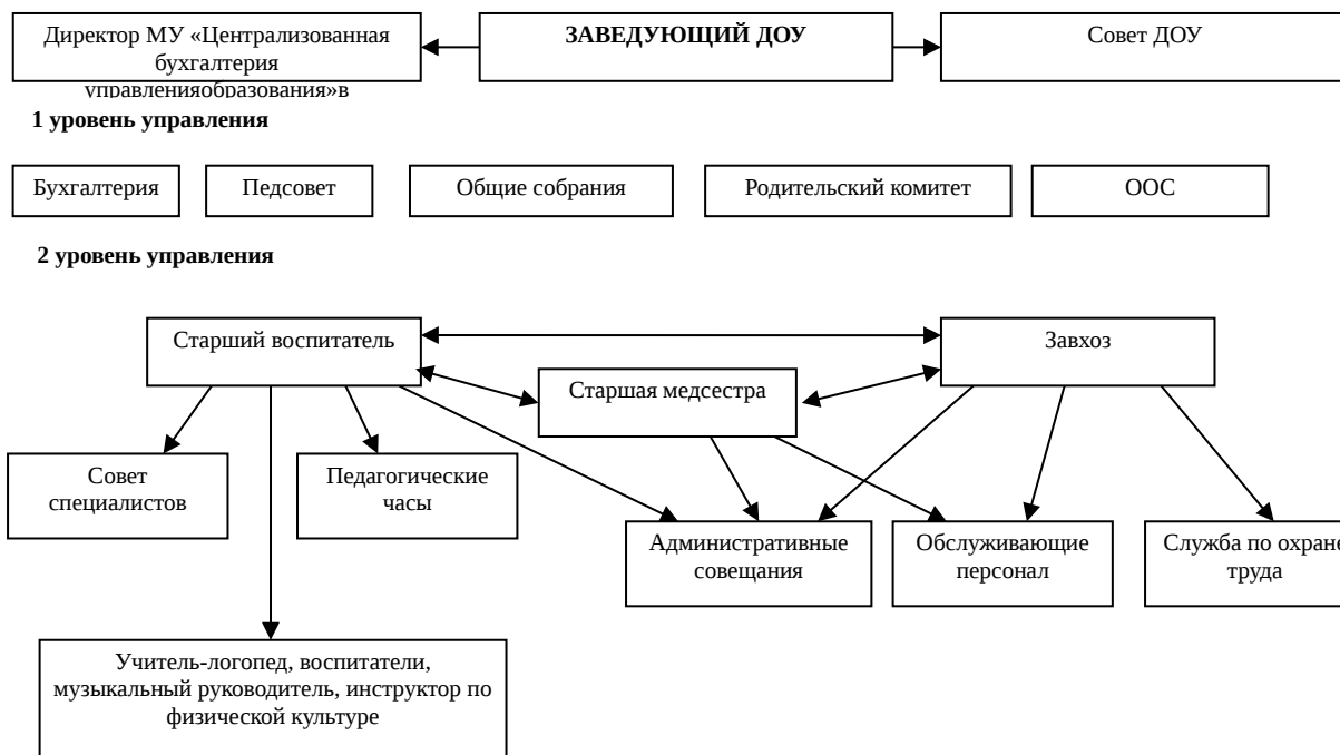
Схема структуры управления ДОУ