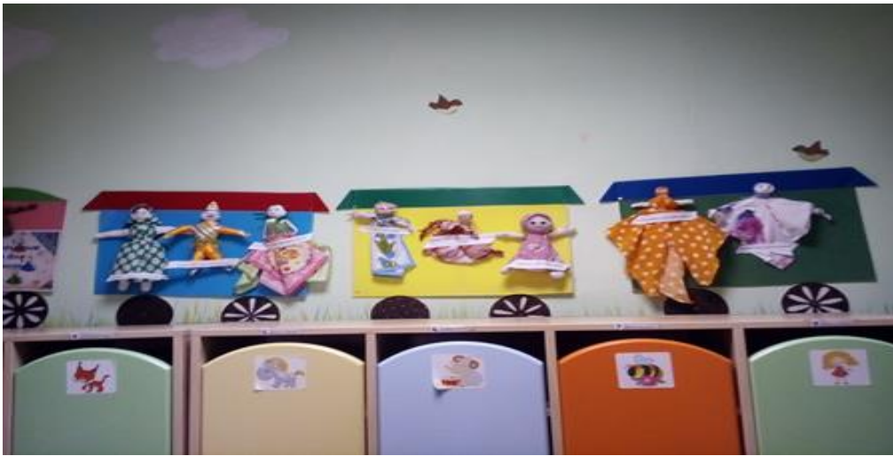
Куклы из платочков для дочек и сыночков